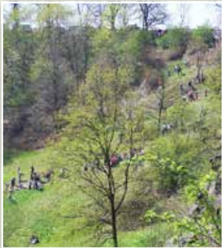
Der Südhang des Prottschenberges in Bautzen – Schauplatz des Ostereierschiebens

Vielerorts findet sich in Brandenburg und Mecklenburg-Vorpommern der Brauch des Ostereiertrudeln, auch Ostereierschieben oder -rollen genannt. Dabei treffen sich befreundete und benachbarte Familien mit Kind und Kegel an geeigneten Hügeln, um dort am Ostersonntag in einem Wettstreit ihre gefärbten Ostereier den Hang hinabrollen zu lassen. Dabei dürfen Stöcke und Ruten zur Hilfe genommen werden, um den liegengeliebenen Eiern zum Weitertrudeln zu verhelfen.