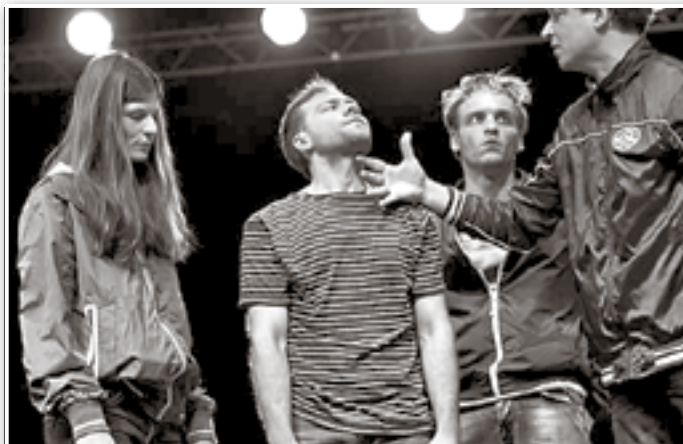
Szenenbild aus „Das Ende von Eddi“ aus dem Theater an der Parkaue, Berlin

So beginnt die Theaterinformation über ein Stück, das zurzeit an der Berliner Parkaue gespielt wird und für die 8. bis 11. Klassen gedacht ist. Mit kleinen Unterbrechungen arbeitet die Goetheoberschule Trebbin seit 11 Jahren mit dem Kinder- und Jugendtheater an der Parkaue zusammen. Mindestens zwei Aufführungen im Jahr werden besucht. Jeweils die 7. Klassen fahren im ersten Halbjahr nach Berlin, wenn uns nicht wie in diesem Schuljahr