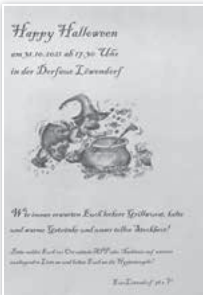
Illustration: Ann-Christin Schaldach