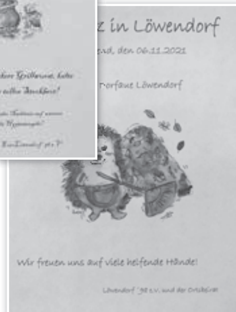
Illustration: Ann-Christin Schaldach