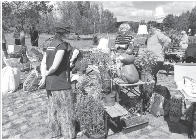
Im Mai wurden Gemüsepflanzen und viele Kräuter getauscht.

Nach den Sommerferien beginnen neue Veranstaltungsformate im NaturParkZentrum am Wildgehege „Glauer Tal“.