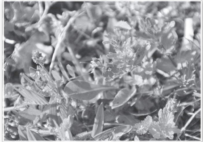
Ehrenpreis ist nur eine der vielen wildwachsenden essbaren Pflanzen.