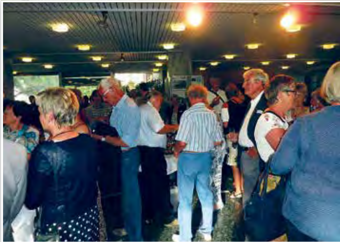
Treffen in Weil am Rhein 2017

Zweimal mussten wir unsere Reise verschieben, aber nun scheint nichts mehr dazwischen zu kommen. Wie schon über 30 Jahre lang treffen wir Städtepartnerschaftsfreunde uns jedes Jahr in einer unserer Partnerstädte. Dieses Mal sind wir 17 Personen, die sich größtenteils per Bahn nach Weil am Rhein aufmachen. Zwischenzeitlich ist der Kontakt nicht verloren gegangen. Die meisten von uns haben sich telefonisch verständigt und festgestellt, dass überall die gleichen Probleme diskutiert wurden. Regelmäßige Videokonferenzen zwischen den drei Vereinsvorständen hielten uns über die doch eingeschränkte Vereinsarbeit