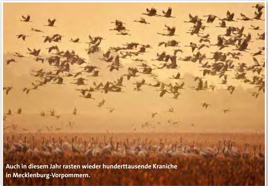
Auch in diesem Jahr rasten wieder hunderttausende Kraniche in Mecklenburg-Vorpommern.

Im Rahmen der 24. Woche des Kranichs, initiiert vom NABU-Kranichzentrum in Groß Mohrdorf bei Stralsund, wird vom 25. September bis 2. Oktober die Rast der Großvögel