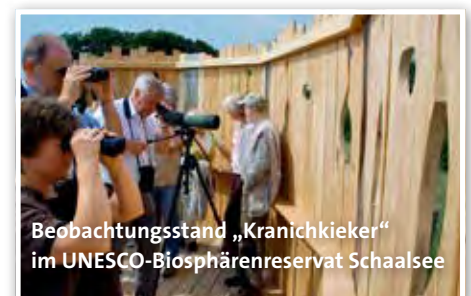
Beobachtungsstand „Kranichkieker“ im UNESCO-Biosphärenreservat Schaalsee