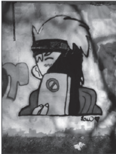
Graffiti-WS 2018