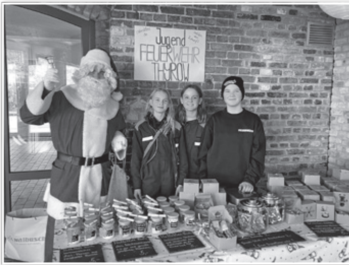
Der Weihnachtsmann und die Jugendfeuerwehr

um uns zu unterhalten mit ihrem Gesang und ihrer Musik. Aber auch die Profis unterhielten uns mit Mittelalterlicher Musik, Irischer Musik und Matthias mit seiner Beschallung sorgte dafür, dass auch alles gut zu hören war und