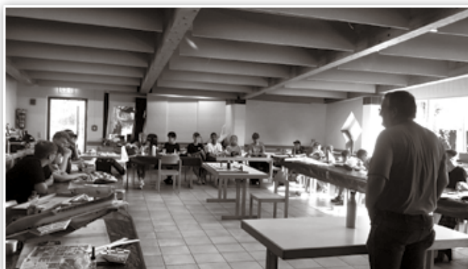
Theorie muss sein