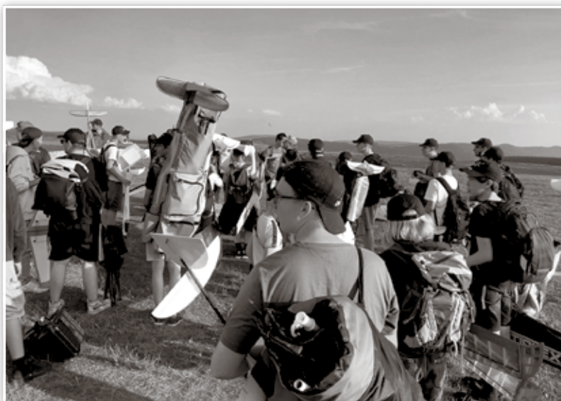
Anreise zum Hang

Das Wetter hielt noch zwei Tage, so dass an verschiedenen