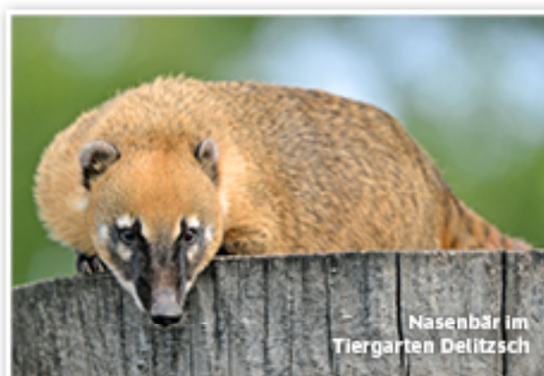
Nasenbär im Tiergarten Delitzsch

Auf der Straßenseite gegenüber dem Tiergarten führen zwei Wege nach rechts. Der linke davon geht als Schachtweg durch Wiesen und vorbei an Gärten. Man folgt der Halleschen Straße bis Am Wallgraben – und befindet sich nun auf einer Promenade zwischen Lober und Wallgraben.