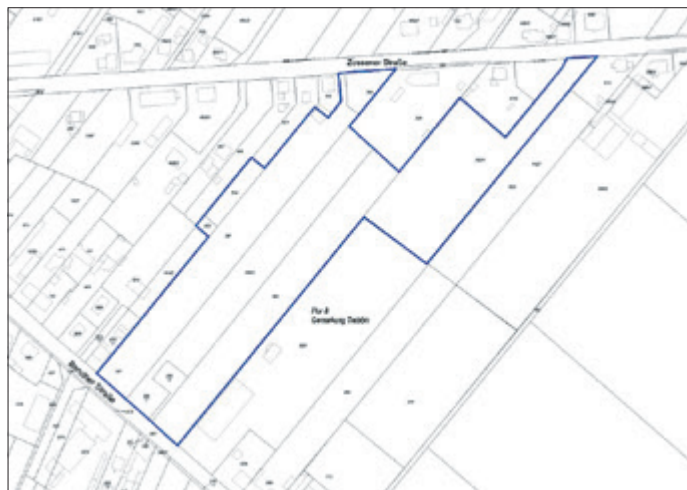
Geltungsbereich (@GeoBasis-DE/LGB, 2022)

Die Verarbeitung personenbezogener Daten erfolgt auf Grundlage des § 3 BauGB in Verbindung mit Art. 6 Abs. 1 Buchstabe e DSGVO und dem Brandenburgischen Datenschutzgesetz. Sofern Sie Ihre Stellungnahme ohne Absenderangaben abgeben, erhalten Sie keine Mitteilung über das Ergebnis der Prüfung. Weitere Informationen entnehmen Sie bitte dem Formblatt: Informationspflichten bei der Erhebung von Daten im Rahmen der Öffentlichkeitsbeteiligung nach dem BauGB (Art. 13 DSGVO), welches mit ausliegt.